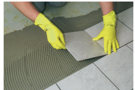
Mit PCI FT Rapid können keramische Fliesen sicher verlegt werden und sind schnell begehbar und verfugbar.