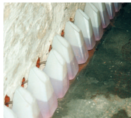
PCI Barra Gisol wird mindestens 24 Stunden lang aus PCI Injektionsbehältern injiziert.